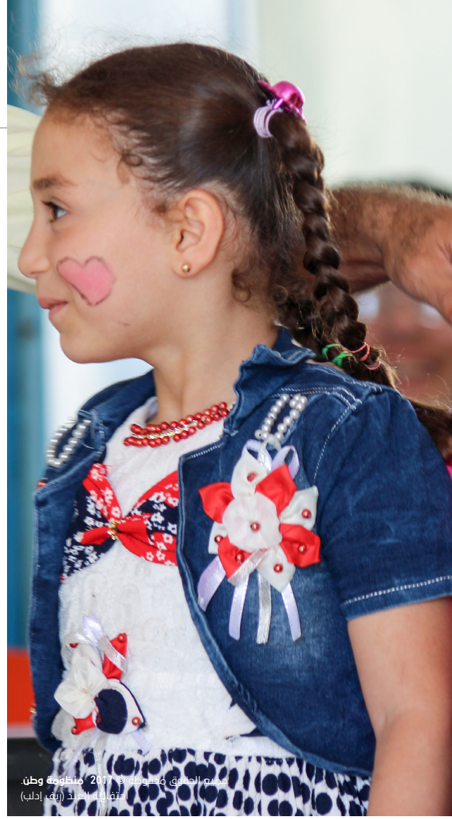
احتفالية العيد (ريف إدلب)