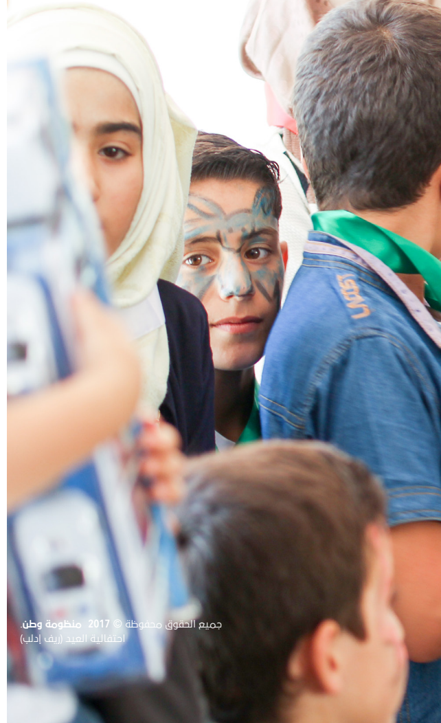
جميع الحقوق محفوظة © 2017 منظومة وطن. احتفالية العيد (ريف إدلب)